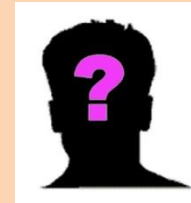
? Référénte Réseaux