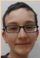
Mériadeg Référént Cartes